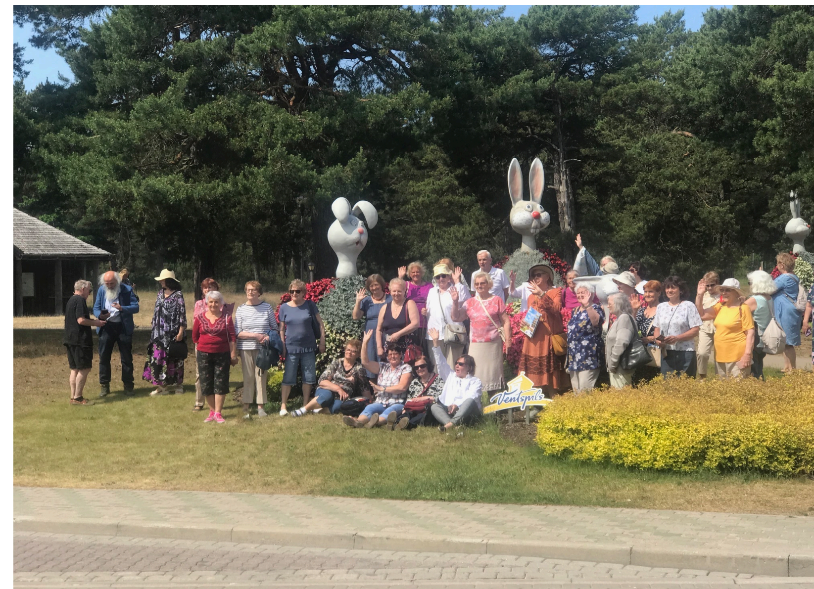
LSKA organizētā izglītojošā ekskursija senioriem Ventspilī, 2023.gada 17.jūnijs