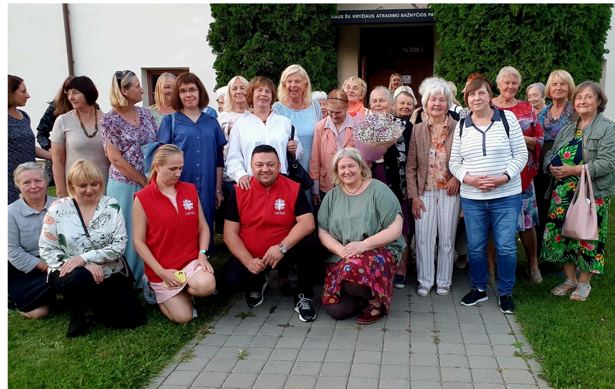
Tikšanās un sadraudzība ar Viļņas Senioru kopienu 2023.gada 11.septembrī, Lietuva

Izveidota biedrības mājas lapa www.lskapvieniba.lv un