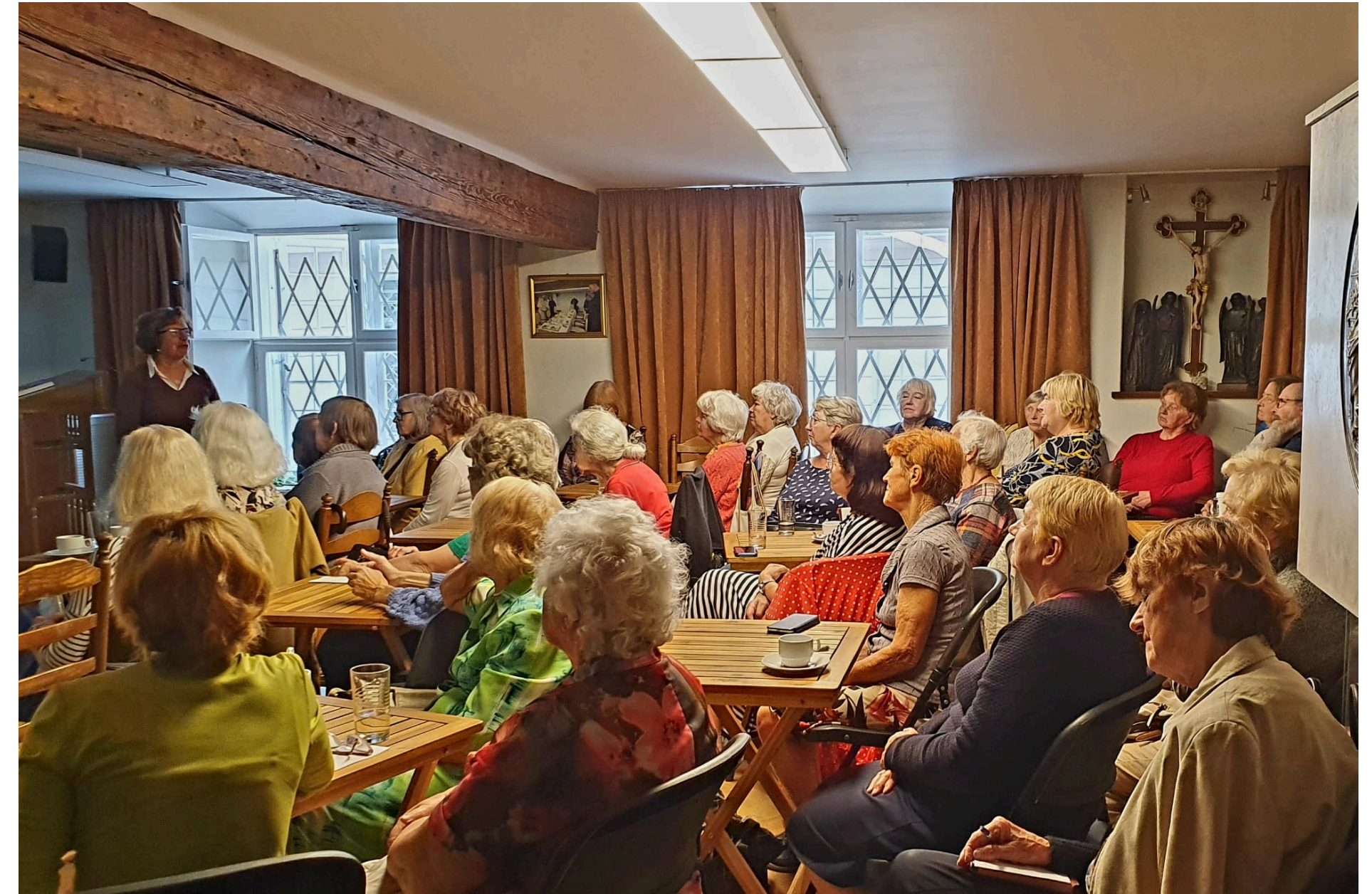
Nodarbība Senioru skolā Biedrības «Svētās ģimenes māja» telpās