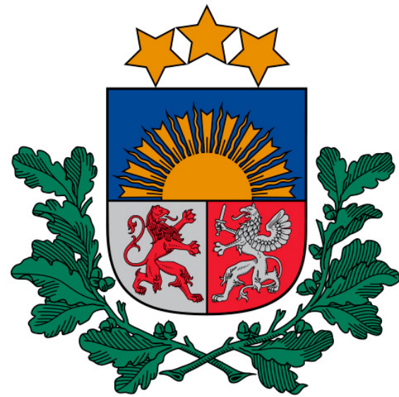
Sabiedrības integrācijas fonds