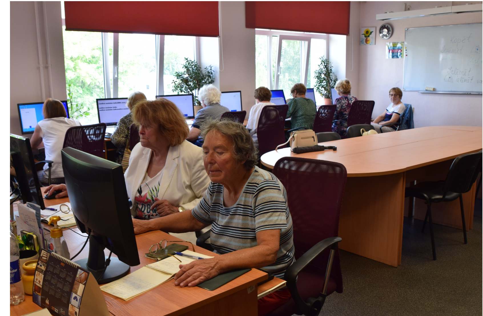
Kuldīgas Senioru skola īsteno projektu «Senioru digitālā mobilitāte», 2023.gads

Esam uzsākuši partnerībā ar biedrību „Vidusdaugavas NVO centrs” īstenot Trešās paaudzes universitāšu tīklu izveidošanu Latvijā.