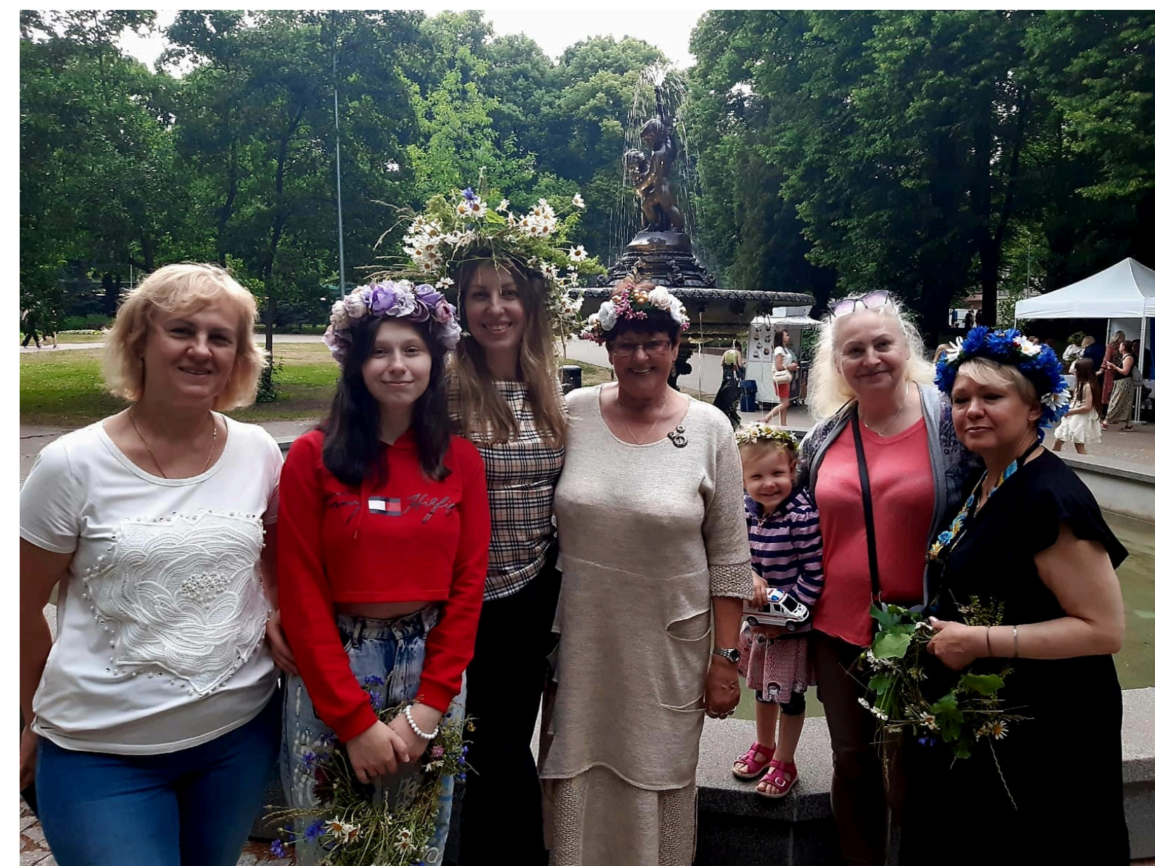
Kopā ar ukraiņiem Vērmanes dārzā 2023.gada 19.jūnijā